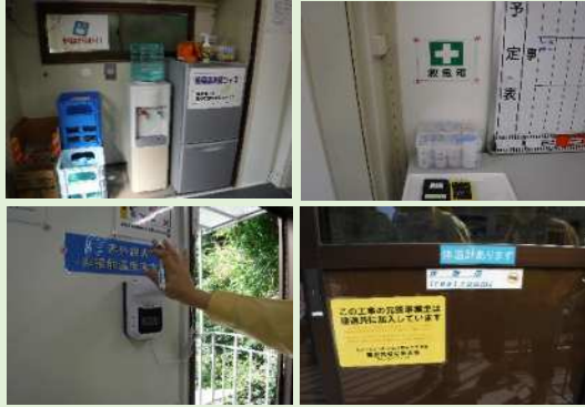
2F休憩所(禁煙) 整理整頓がいきとどいてるのは数々の 見やすい掲示物のお かげですね♪ こちらにも体温計が 設置されています。