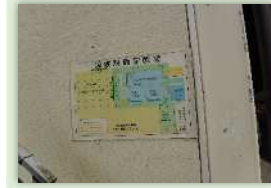
現場設備配置図 どこになにがあるか 誰が見ても一目瞭然です！