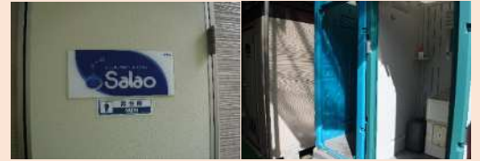
男子トイレ 男子トイレも女子トイレ同様のきれいな水洗 トイレが設けられています。元が綺麗だと継 続して綺麗に使おうと心がけられます！