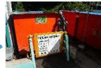
産業廃棄物 保管場所