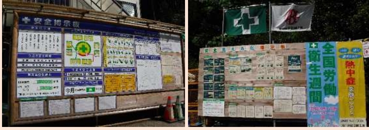
安全掲示板 配置も色使いも見やすくわかりやすいです！