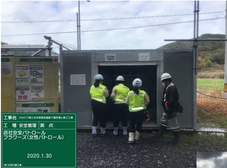
工事名 大分212号三光本郡高深道路下部形構上部工事 工種 安全管理 測点 店社安全パトロール フラウーズ(女性パトロール) 2020.1.30 (株)安部日鋼工業