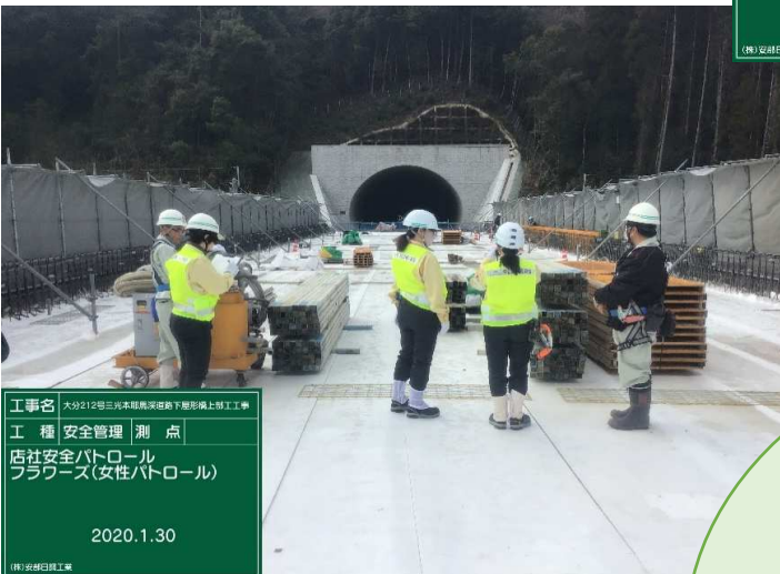
工事名 大分212号三光本郡高深道路下部形構上部工事 工種 安全管理 測点 店社安全パトロール フラウーズ(女性パトロール) 2020.1.30 (株)安部日鋼工業

今回のパトロールは、九州支店のみで行いました。雨が心配されていましたが、パトロール中はお天気もよくスムーズにパトロールを終えることができました。 完工まで間もなくです。無事故・無災害で完工を迎えられるようご安全に！