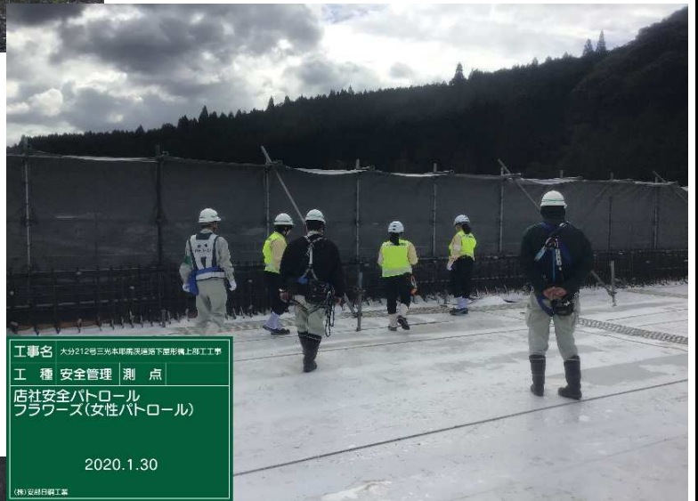
工事名 大分212号三光本郡高深道路下部形構上部工事 工種 安全管理 測点 店社安全パトロール フラウーズ(女性パトロール) 2020.1.30 (株)安部日鋼工業