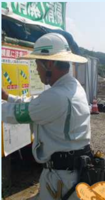
ヘルメット用 麦わらバイザー