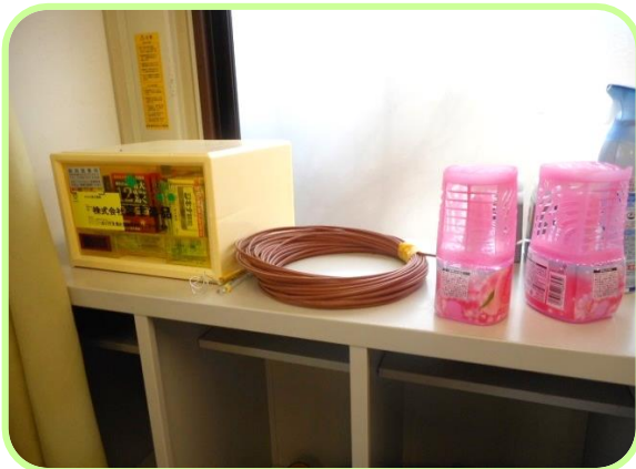
救急箱の表示・設置ともによかったです。