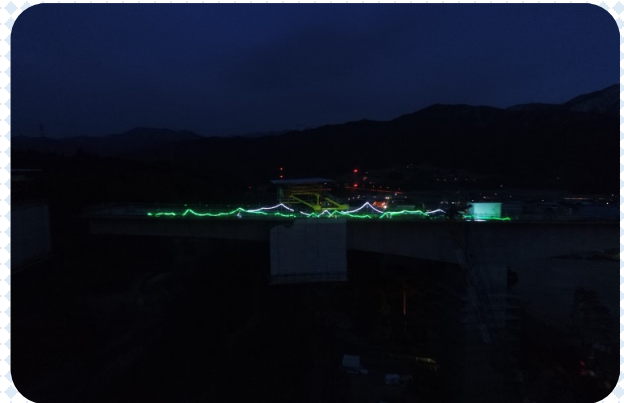
アルプスイルミネーション

2017年10月末日より、夜間にイルミネーションを行って現場のイメージアップに取り組んでいます。スズラン灯とLED電球、ランプカラーを使用し、自作することで費用を抑え、低コストで実現しています。地域の方から好評を得ることができ、町から感謝状もいただきました。