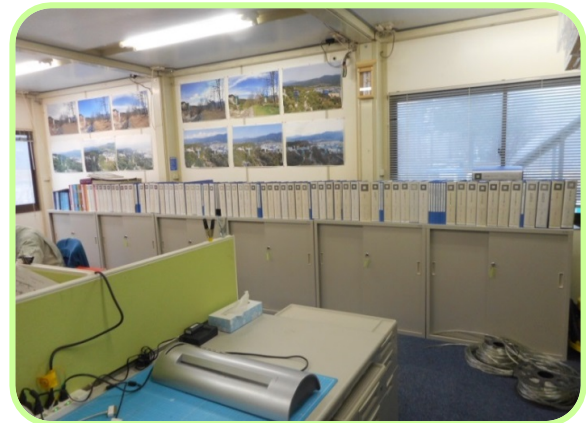
ファイルがきちんと整列して見やすいです。