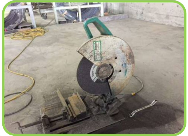
↑ 高速切断機にはカバーを付けてください。