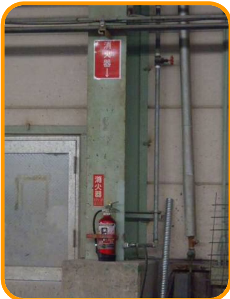
← 消火器設置場所が遠くからでもわかるように工夫されていてとても良いと思います。