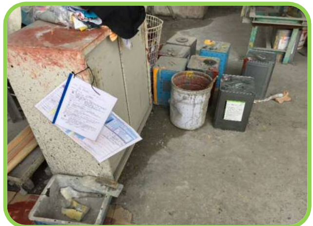
↑ 化学物質を含む材料とSDSの管理を徹底してください。