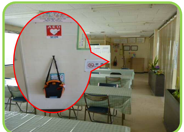
↑ 厚生棟2階奥にAEDが設置されていたので取りに行きやすい場所に変更すると良いですね。