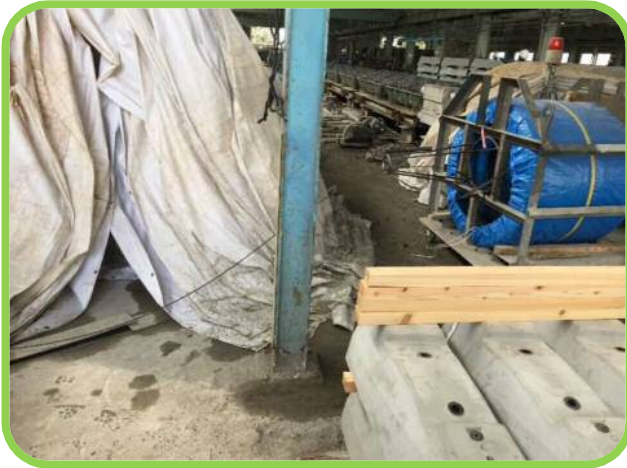
↑ 使用中のPC鋼線の周りにコーン等を設置してください。