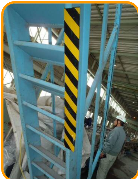
↑ 通路内にある階段の下側に保護カバーがされていました。