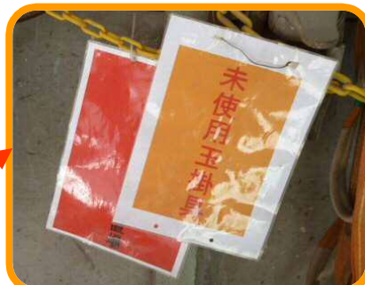
← 未使用玉掛具を一箇所で管理し、使用する前には点検するよう明記されていました。