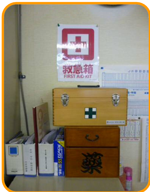
↑ 救急箱の場所がきちんと表示されて設置してありました。