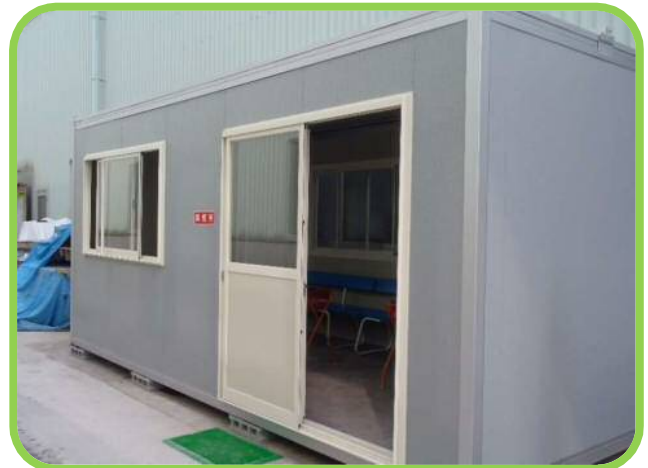
↑ 建屋の間に喫煙者用のプレハブがありました。 こちらもしっかり整理されて消火器も設置してありましたが、火元責任者の表示がありませんでした。