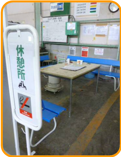
↑ 場内の休憩所は整理されていて禁煙の表示がありました。 きちんと分煙されています。