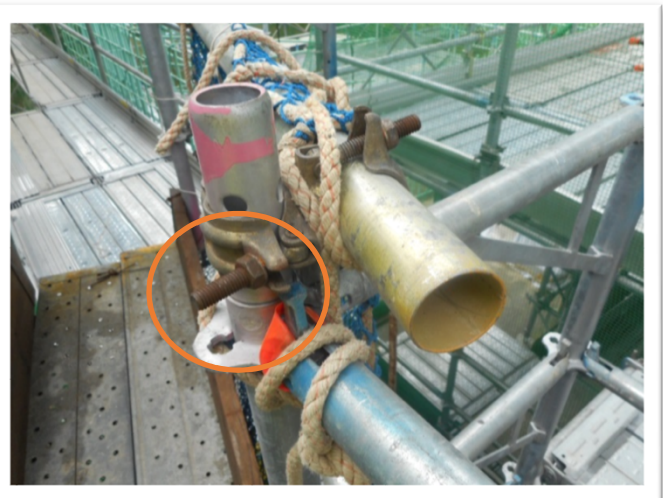
↑ クランプのボルトが通路に出ている ため、作業着の袖に引っ掛かります。 保護カバーを取り付けるといいですよ。