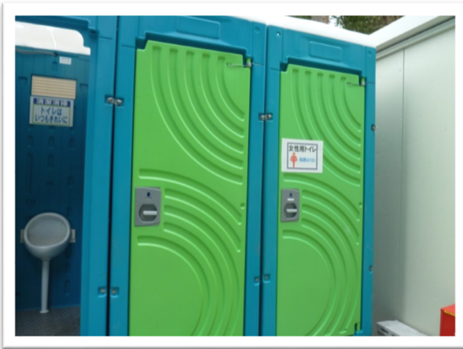
＜1回目のパトロール＞

↑ 1回目のパトロール時の指摘が改善され、女性用トイレが男性用と離して設置されていました。女性への気配りが行き届いています。