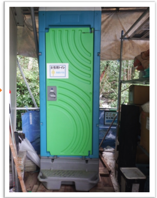
＜今回のパトロール＞