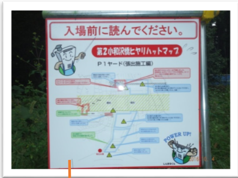
＜ヒヤリハットマップ＞