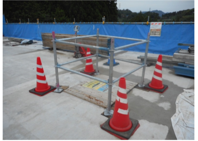
↑ つまづき対策や開口部の表示、立入禁止措置がしっかりされていました。